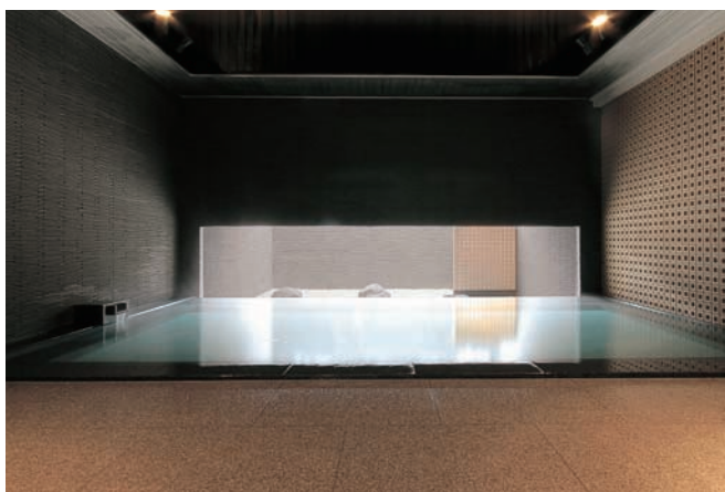
■枯山水の坪庭を眺める「残月峰」2F

ガラスパネルの大開口部から雄大な大雪山連峰を望む雲海の湯「黒岳」と、大自然に抱かれる天空露天風呂「朝陽山」が控える、解放感あふれる7階。また2階癒しの湯「桂月」には、枯山水の坪庭を配した「残月峰」と、水墨画風の壁が幽玄な雰囲気をもたらせる「瞑想の湯」という、意匠を凝らした2つの湯舟を。多彩な湯と眺めを心ゆくまでお楽しみください。